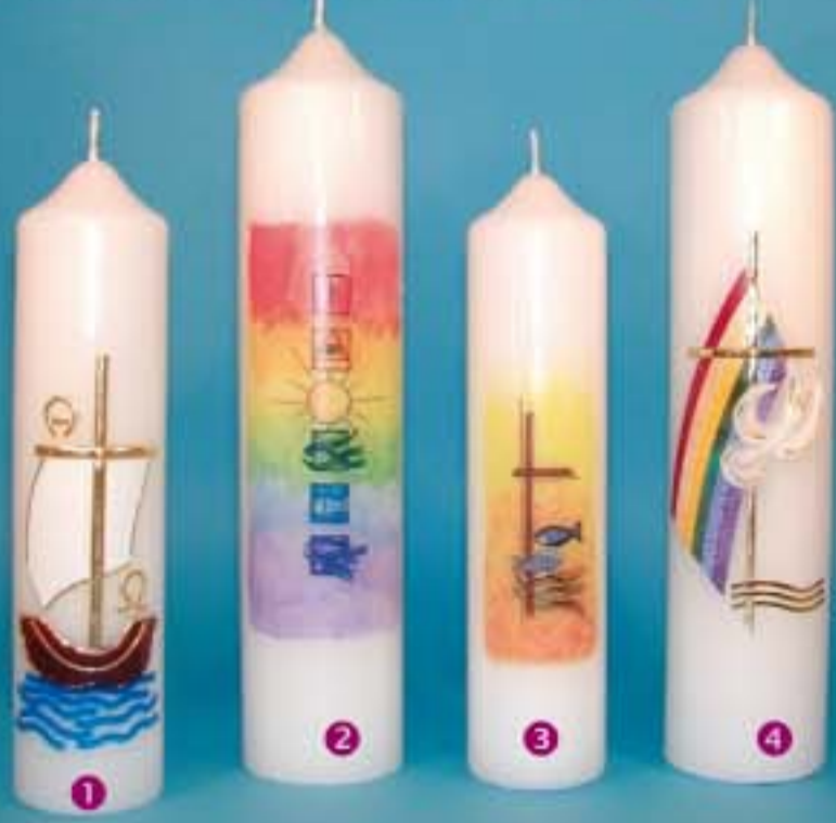
cellophaniert, im Einzellkarton verpackt