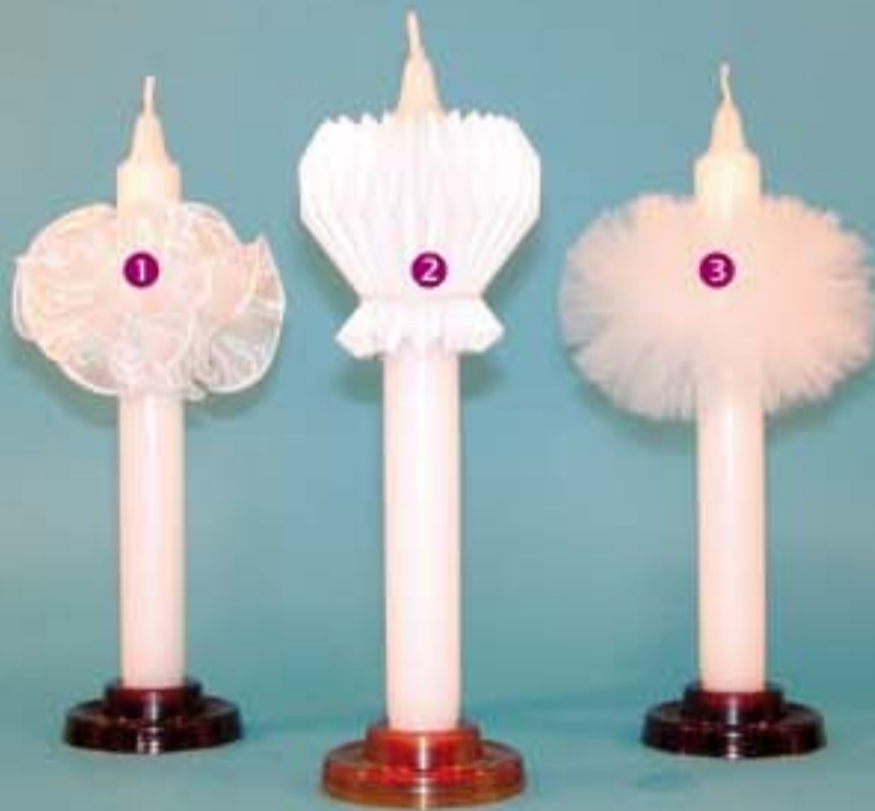
2 Papierrosette, Nr. 3122, St. 0,83 €, VE 50